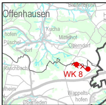
WK 8: rechtsverbindlicher Stand im Regionalplan

gez. Eberhard Irlinger Landrat, Verbandsvorsitzender